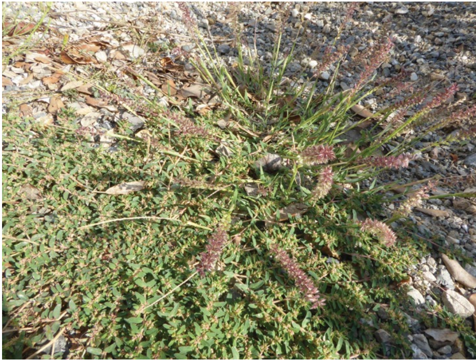
Figure 1 : Vue générale du Trago racemosi – Euphorbietum prostratae .